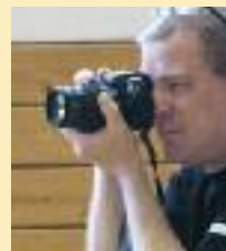
René Weil Vereinsfotograf