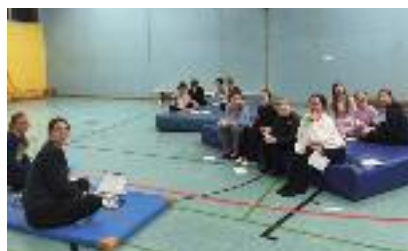
Ausbildung im Turnen