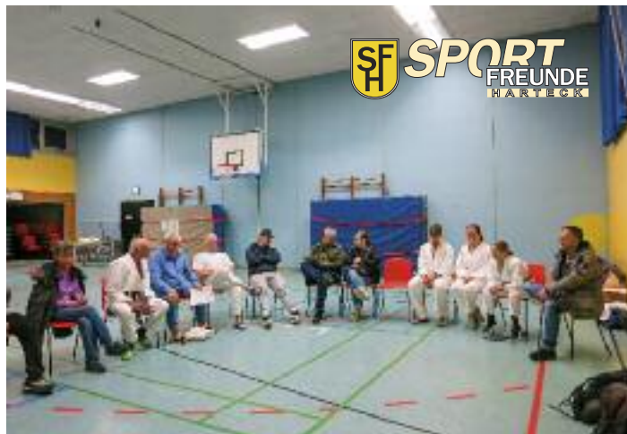
Mitgliederversammlung im Ju-Jutsu

Großes Titelbild: Ju-Jutsu-Training Kleines Bild: Taekwondo-Erfolg