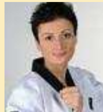
Serat Askin Beisitzer Jugendleitung