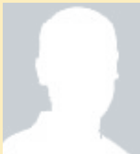
Derzeit nicht besetzt Fußball