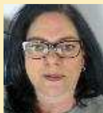
Barbara Franz Geschäftsstelle